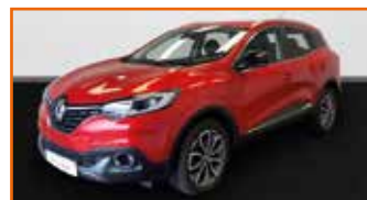
RENAULT KADJAR DCI 110 ENERGY GRAPHITE, 11/2017, 45 869 km, Garantie 12 mois • 17 990 €