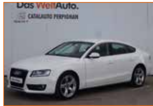
AUDIA5 SPORTBACK TDI 245 SPORTLINE, 2011, 117 000 km, Garantie 12 mois.