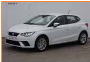
SEAT IBIZA TSI 95 STYLE, 2019, 6 800 km, Garantie 24 mois.