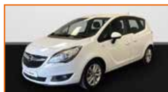
OPEL MERIVA 1.4 TURBO 120 START/STOP DRIVE TWINPORT, 05/2017, 26 408 km, Garantie 12 mois • 11 990 €