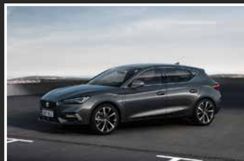
La Leon e-Hybrid est disponible en version berline ou sportstourer.