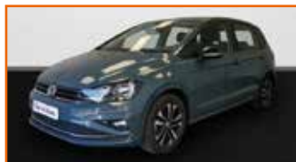
VOLKSWAGEN GOLF SPORTSVAN 1.0 TSI 115 BVM6 IQ DRIVE, 10/2019, 13 428 km, Garantie 24 mois • 21 490 €