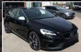
VOLVO V40 T2 122 GEARTRONIC 6 R-DESIGN , 02/2020, 3 000 km, Essence