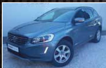
VOLVO XC60 D4 AWD 190 SUMMUM GEARTRONIC A , 05/2015, 78 000 km, Diesel