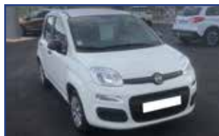
FIAT PANDA 1.2 8 V 69 S&S POP 2019 EURO 6D , 05/2019, 14 297 km, radio, airbags, ABS, ESP, climatisation,... Garantie* 8 290 €