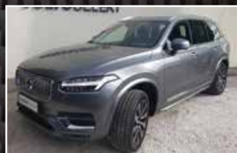
VOLVO XC90 B5 AWD 235 GEARTRONIC 8 7PL INSCRIPTION , 02/2020, 10 km, Diesel