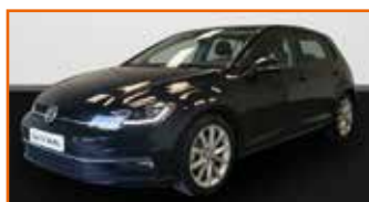
VOLKSWAGEN GOLF 2.0 TDI 150 FAP DSG7 IQ.DRIVE 12/2019, 14 254 km, Garantie 24 mois • 27 490 €