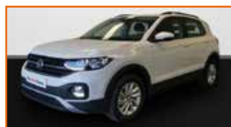
VOLKSWAGEN T-CROSS 1.0 TSI 115 START/STOP BVM6 LOUNGE, 03/2020, 10 km, Garantie 12 mois • 22 990 €