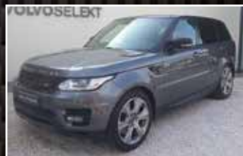
RANGE ROVER SPORT MARK I SDV6 3.0L HYBRIDE HSE A , 09/2015, 109 000 km, Hybride