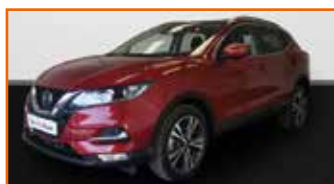
NISSAN QASHQAI 1.7 DCI 150 N-CONNECTA XTRO 4X4, 05/2019, 18 622 km, Garantie constructeur • 25 990 €