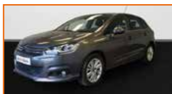
CITROEN C4 E-HDI 115 MILLENNIUM ETG6, 06/2015, 41 459 km, Garantie 12 mois • 12 990 €