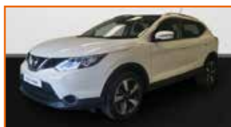
NISSAN QASHQAI 1.5 DCI 110 N-CONNECTA 1 ÈRE MAIN, 09/2016, 29 657 km, Garantie 12 mois • 18 990 €