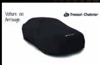
VOLVO XC40 B4 DIESEL BUSINESS AWD 197 , 11/2019, 2 100 km, Diesel