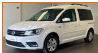
VOLKSWAGEN UTILITAIRES CADDY 2.0 TDI 102 CONFORTLINE, 06/2019, 14 312 km, Garantie 24 mois • 19 990 €