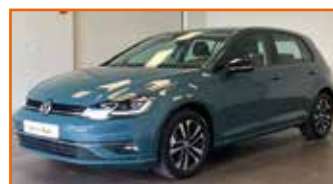
VOLKSWAGEN GOLF 1.6 TDI 115 FAP DSG7 IQ DRIVE, 08/2019, 23 726 km, Garantie 24 mois • 23 690 €