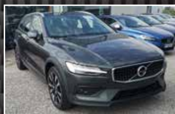
VOLVO V60 CROSS COUNTRY D4 AWD 190 GEARTRONIC 8 PRO , 07/2020, 3 000 km, Diesel