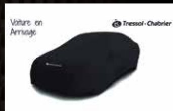
AUDI Q3 2.0 TDI 184 S TRONIC 7 QUATTRO S LINE , 01/2016, 75 733 km, Diesel