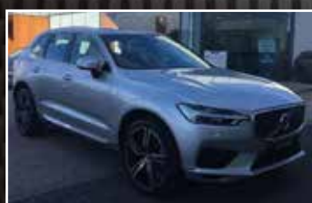
VOLVO XC60 T4 190 GEARTRONIC 8 R-DESIGN , 12/2019, 5 000 km, Essence