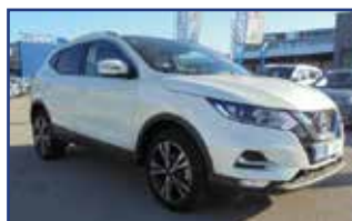
QASHQAI 1.2 DIG-T 115 N-CONNECTA , 08/2018, 8 908 km, Bluetooth, J.A., ordinateur de bord, climatisation,... Garantie* 19 490 €