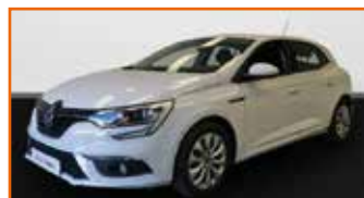
RENAULT MÉGANE IV BERLINE TCE 100 ENERGY LIFE 1 ÈRE MAIN, 03/2018, 51 184 km, Garantie 12 mois • 13 990 €