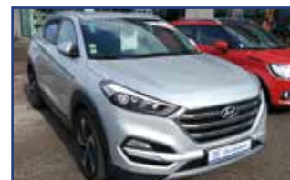
HYUNDAI TUCSON 1.7 CRDI 115 EDITION LOUNGE 2WD , 02/2017, 62 631 km, caméra de recul, Bluetooth, 1 ère main,... Garantie* 18 900 €

* Garantie 6 mois, 12 mois ou garantie constructeur selon modèle avec possibilité d'extension de garantie jusqu'à 5 ans, via un Financement. Voir conditions en concession.