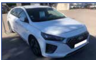
HYUNDAI IONIQ HYBRID 141 EXECUTIVE , 06/2019, 12 833 km, Climatisation, radio numérique DAB, mode ECO,... Garantie* 26 600 €