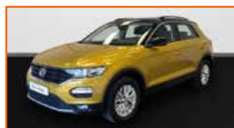
VOLKSWAGEN T-ROC 1.0 TSI 115 START/STOP BVM6 LOUNGE, 12/2018, 26 426 km, Garantie 12 mois • 21 990 €