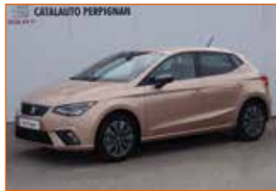
SEAT IBIZA TSI 115 DSG XCELLENCE, 2019, 12 900 km, Garantie 24 mois.