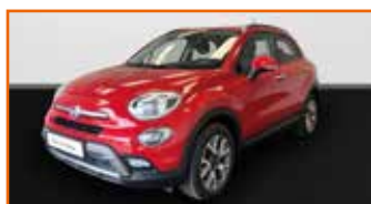
FIAT 500X 1.4 MULTIAIR 140 CROSS, 05/2019, 50 031 km, Garantie 12 mois • 13 990 €