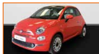
FIAT 500C 1.2 69 ECO PACK LOUNGE, 06/2020, 10 km, Garantie 12 mois • 14 290 €

Volkswagen recommande Castrol EDGE Professional. Voir conditions générales et exclusions des engagements 'Das WeltAuto' auprès de votre Partenaire 'Das WeltAuto'.