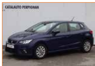
SEAT IBIZA 1.6 TDI 95 STYLE, 2018, 90 600 km, Garantie 12 mois.