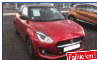
SUZUKI SWIFT 1.2 DUALJET HYBRID 83 PACK , 09/2020, 446 km, ABS, climatisation, ordinateur de bord, Bluetooth,... Garantie* 16 900 €