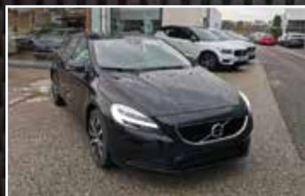
VOLVO V40 T2 122 GEARTRONIC 6 SIGNATURE EDITION , 02/2020, 3 000 km, Essence