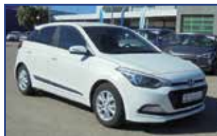
HYUNDAI I20 1.2 84 UEFA EURO 2016 , 05/2016, 20 888 km, Radar AV/AR, climatisation, régulateur, Bluetooth,... Garantie* 10 490 €