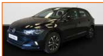
VOLKSWAGEN POLO 1.0 TSI 95 S&S DSG7 IQ.DRIVE, 06/2019, 12 681 km, Garantie 12 mois • 17 490 €