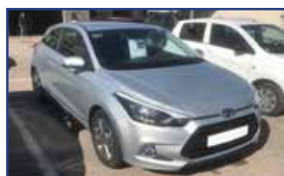
HYUNDAI I20 COUPE 1.2 84 INTUITIVE , 04/2018, 7 869 km, Sleek Silver, ABS, fixation isofix, volant cuir, régulateur,... Garantie* 12 790 €

Garantie 3 ans ou 100 000 km au 1 er terme échu. www.suzuki.fr