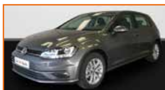
VOLKSWAGEN GOLF 2.0 TDI 150 DSG7 BUSINESS, 07/2020, 10 km, Garantie 24 mois • 23 990 €