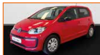
VOLKSWAGEN UP 1.0 60 BLUEMOTION TECHNOLOGY BVM5 MOVE UP!, 09/2019, 10 852 km, Garantie 24 mois • 11 990 €