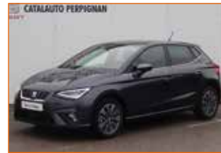
SEAT IBIZA TSI 95 XCELLENCE, 2020, 14 200 km, Garantie 24 mois.