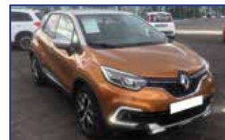
RENAULT CAPTUR 1.2 TCE 120 ENERGY INTENS EDC , 06/2018, 13 118 km, Climatisation, Bluetooth, airbags, ABS,... Garantie* 14 900 €