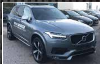
VOLVO XC90 D5 AWD ADBLUE 235 GEARTRONIC 7PL R-DESIGN , 12/2019, 7 000 km, Diesel