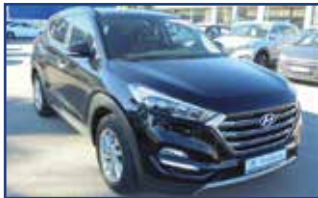
HYUNDAI TUCSON 1.7 CRDI 115 EXECUTIVE 2WD , 12/2015, 76 663 km, Clim. auto. bi-zones, Bluetooth, J.A., régulateur,... Garantie* 16 900 €