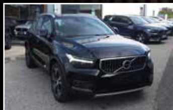
VOLVO XC40 T5 RECHARGE 180/82 DCT7 INSCRIPTION, 08/2020, 1 500 km, Hybride