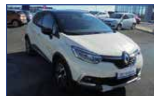
RENAULT CAPTUR 1.2 TCE 120 ENERGY INTENS EDC , 06/2017, 12 609 km, climatisation, Bluetooth, airbags, ABS,... Garantie* 13 490 €