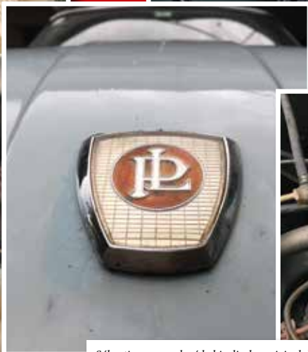
Sébastien a remplacé le bicylindre originel de 50 ch par un moteur Tigre équipant les dernières versions de Panhard 24 et développant 10 ch de plus grâce à un arbre à came, carburateur double corps et échappement spécifique. A noter que la pompe à essence sujette au vapor lock par la turbine d'air du moteur, une technique issue du département Panhard compétition.