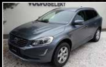
VOLVO XC60 BUSINESS D4 AWD 190 GEARTRONIC 6 , 03/2017, 78 711 km, Diesel