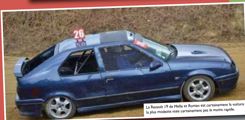
La Renault 19 de Melle et Roman est certainement la voiture la plus modeste mais certainement pas la moins rapide.