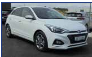
HYUNDAI I20 1.0 T-GDI 100 INTUITIVE , 09/2018, 37 749 km, Régulateur, J.A., climatisation, radio, bluetooth,... Garantie* 12 290 €