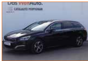
PEUGEOT 508 SW 2.0 BLUEHDI 180 EAT6 FÉLINE, 2015, 105 500 km, Garantie 6 mois.