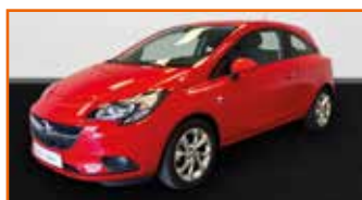
OPEL CORSA 1.4 90 EXCITE, 05/2018, 23 545 km, Garantie 12 mois • 10 990 €