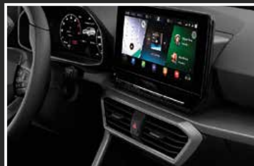
La toute nouvelle SEAT Leon est le premier véhicule entièrement connecté de la marque, permettant aux passagers de rester en contact avec leur vie numérique.