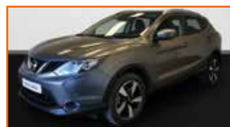
NISSAN QASHQAI 1.2 DIG-T 115 S&S CONNECT EDITION, 03/2016, 50 413 km, Garantie 12 mois • 15 990 €