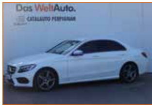
MERCEDES CLASSE C 200 D SPORTLINE 7 G, 2016, 87 300 km, Garantie 12 mois.