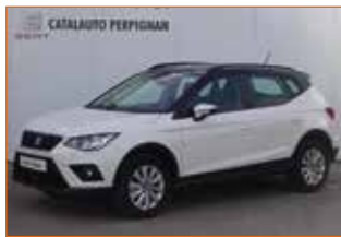
SEAT ARONA TSI 95 STYLE, 2019, 18 200 km, Garantie 24 mois.