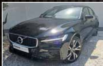
VOLVO S60 T8 TWIN ENGINE 303/87 GEARTRONIC 8 R-DESIGN FIRST , 11/2019, 13 731 km, Hybride