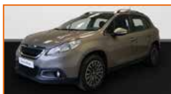
PEUGEOT 2008 1.6 E-HDI 92 FAP BVM5 BUSINESS, 04/2014, 55 277 km, Garantie 12 mois • 11 490 €