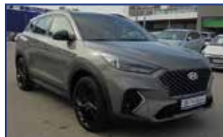
HYUNDAI TUCSON 1.6 CRDI 136 N LINE DCT-7 EURO6D-EVAP , 09/2019, 19 316 km, Clim. auto., bluetooth, radar AR, J.A.,... Garantie* 30 900 €