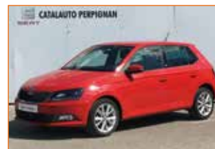
SKODA FABIA 1.2 TSI 90 GREENTEC, 2016, 62 600 km, Garantie 12 mois.