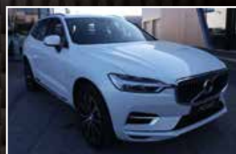
VOLVO XC60 T6 RECHARGE AWD 253/87 GEARTRONIC 8 , 08/2020, 5 000 km, Hybride