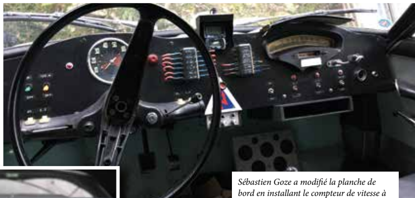
Sébastien Goze a modifié la planche de bord en installant le compteur de vitesse à droite. Cela permet au copilote d'être plus performant dans les épreuves de régularité.