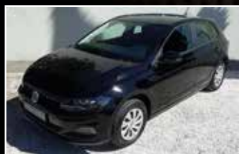
VOLVO XC60 BUSINESS D4 AWD 190 GEARTRONIC 6 , 03/2017, 78 711 km, Diesel