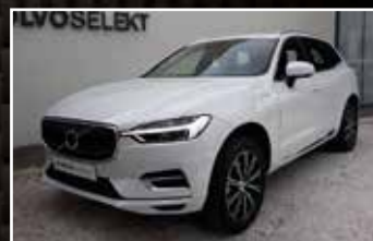
VOLVO XC60 T8 TWIN ENGINE 320 GEARTRONIC 8 INSCRIPTION LUXE , 02/2019, 10 963 km, Hybride