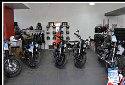
En complément des motos Vintage, Au2roo propose des vestes, casques et différents accessoires.