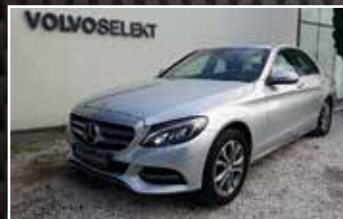
MERCEDES CLASSE C 220 D FASCINATION 7G-TRONIC A, 04/2014, 80 500 km, Diesel