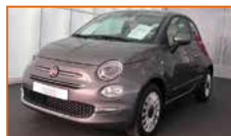
FIAT 500 1.2 8V 69 LOUNGE, 04/2019, 10 km Garantie 24 mois 10 990 €