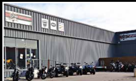
Implanté au cœur de la zone Croix Sud à Narbonne, le magasin de 400 m² aura bientôt un nouvel espace Off-Road.