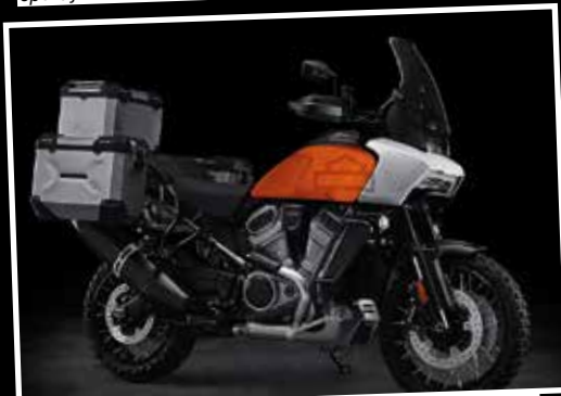
Look ultra-futuriste pour le premier trail de la marque, le Pan America™.