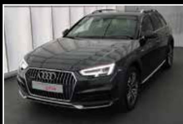
AUDI A4 ALLROAD TDI 272 TIPTRONIC 8, DESIGN LUXE 02/2018, 55 500 km Garantie 24 mois ▶ 45 900 €