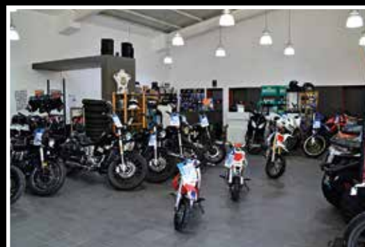
La gamme BASTOS propose des Cross de 50 à 150 cm³, à un tarif très compétitif.