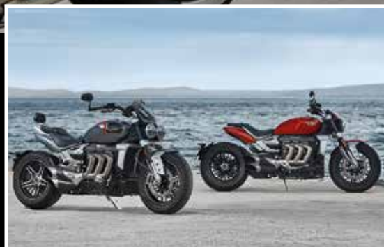
La Rocket 3 est un modèle iconique pour les motards aguerris.

Pour ceux qui ont la chance de pouvoir aller au Salon de la Moto de Narbonne, c'est une véritable avant-première qui sera sur le stand Pascal Moto, puisque le lancement officiel de la nouvelle Tiger 900 a lieu le 19 mars à Montpellier . Une soirée de lancement sur inscriptions via facebook, est prévue à la concession.