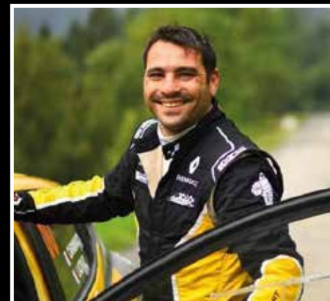
Propos recueillis par Dorian Hirat.

B.C. : Je n'ai pas de programme particulier prévu. Pourquoi ne pas essayer d'être présent aux Cévennes. Mon père prend sa retraite cette année et il va falloir se concentrer sur l'entreprise.