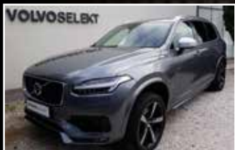
VOLVO XC90 D5 AWD 235 GEARTRONIC 7PL LUXE, 10/2017, 90 000 km, Diesel