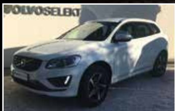
VOLVO XC60 D4 190 CH R-DESIGN GEARTRONIC A, 06/2016, 70 200 km, Diesel