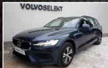
VOLVO V60 D3 150 CH GEARTRONIC 8 MOMENTUM, 05/2019, 10 259 km, Diesel