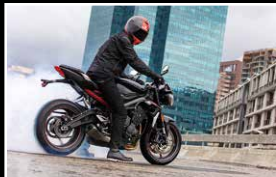
La Street Triple séduit les jeunes permis A2. A découvrir aussi la nouvelle Street Triple RS, pour les confirmés.