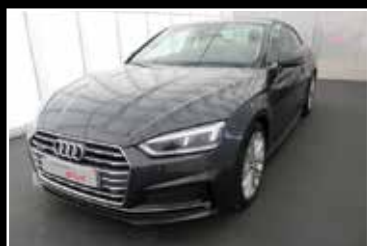
AUDI A5 COUPÉ TDI 218 V6 S-TRONIC 7, DESIGN LUXE, 02/2017, 71 200 km Garantie 24 mois ▶ 34 900 €