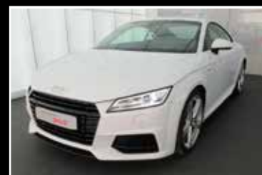
AUDI TT COUPÉ TFSI 231 S-TRONIC 6 S-LINE 12/2016, 36 500 km Garantie 24 mois ▶ 33 900 €