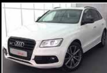
AUDI SQ5 BI-TDI PLUS 340 TIPTRONIC 8 12/2016, 94 800 km Garantie 24 mois ▶ 43 900 €