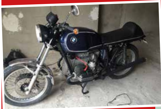
La BMW R100 de 1980 à l'aspect aujourd'hui un peu désuet a retrouvé une seconde jeunesse en se transformant en Scrambler.

Le phénomène Scrambler est très à la mode en ce moment chez les constructeurs mais en confiant la modification de sa BMW à l'entreprise Au2Roo, Cyril Buesa s'est assuré de disposer d'un exemplaire unique.