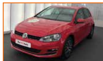
VW GOLF 1.2 TSI 110 BLUEMOTION TECHNOLOGY ALLSTAR, 09/2016, 50 000 km, Garantie 12 mois 15 990 €