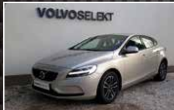
VOLVO V40 T2 122 MOMENTUM, 11/2017, 31 233 km, Boîte mécanique, Essence