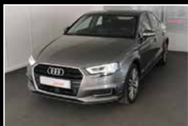
AUDI A3 BERLINE TDI 150 S-TRONIC 7, DESIGN LUXE 03/2018, 17 383 km Garantie 24 mois ▶ 29 900 €