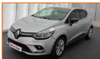
RENAULT CLIO TCE 90 E6C LIMITED, 03/2018, 17 200 km, Garantie 12 mois 11 490 €