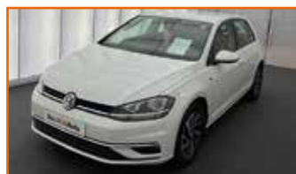
VW GOLF 1.6 TDI 115 FAP BVM5 CONNECT, 03/2019, 18 600 km, Garantie 24 mois 20 990 €