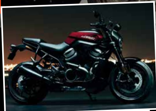
Commercialisé fin 2020, le Bronx™ est le nouveau roadster sportif de la marque.

Mais que les inconditionnels de la marque se rassurent, tout le reste de la gamme actuelle reste au catalogue ! L'ensemble des modèles phares sera exposé au Salon de Narbonne, avec notamment les Softail 2020, qui grâce à leurs nouveaux châssis et moteurs, rencontrent un grand succès. Et du 17 au 18 avril, c'est le Freedom Tour chez Macadam Montpellier. Pensez à réserver vos essais !