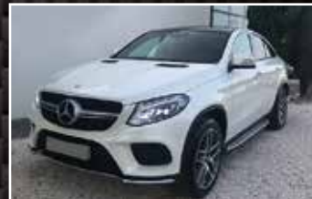
MERCEDES GLE 350 D COUPÉ 4MATIC FASCINATION BA, 10/2016, 98 496 km, Diesel