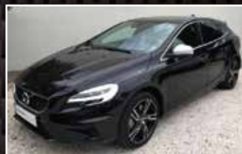
VOLVO V40 SIGNATURE EDITION T2 122, 02/2019, 17 365 km, Essence