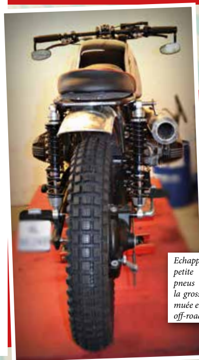
Echappement haut, petite selle plate et pneus à crampons, la grosse routière s'est muée en parfait engin off-road.