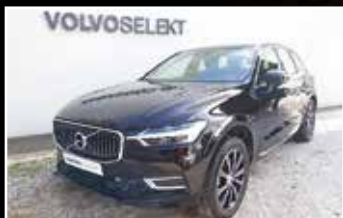
VOLVO XC60 D4 ADBLUE 190 GEARTRONIC 8 INSCRIPTION, 04/2019, 13 732 km, Diesel