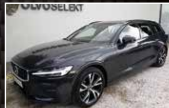
VOLVO V60 D4 GEARTRONIC RDESIGN, 04/2019, 16 350 km, Diesel