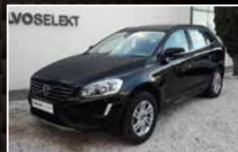
XC60 BUSINESS D4 AWD 181 S&S MOMENTUM BUSINESS, 11/2016, 119 987 km, Diesel,