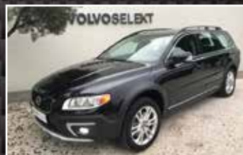
VOLVO XC70 D4 AWD 181 SUMMUM GEARTRONIC A 02/2014, 86 547 km, Diesel