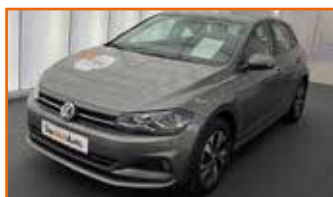
VW POLO 1.0 TSI 95 S&S BVM5 CONNECT, 11/2018, 18 400 km, Garantie 12 mois 15 490 €