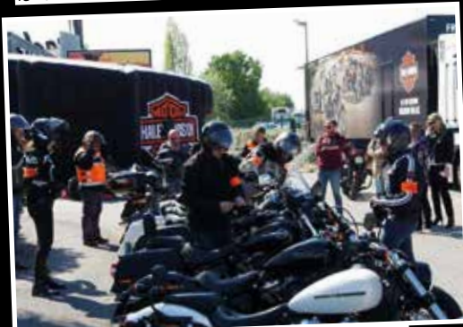
Du 17 au 18 avril, c'est le Freedom Tour à Montpellier, chez Macadam. Réservez vos essais !