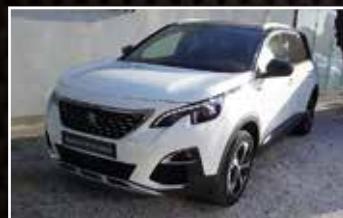
PEUGEOT 5008 PURETECH 180 S&S EAT8 GT LINE, 01/2019, 88 564 km, Essence