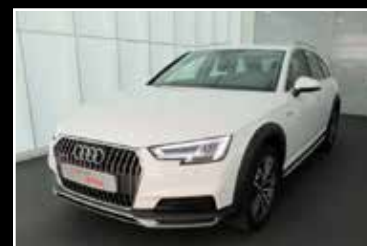
AUDI A4 ALLROAD TDI 190 S-TRONIC 7, DESIGN LUXE 11/2016, 59 650 km Garantie 24 mois ▶ 34 900 €