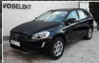
VOLVO XC60 D4 181 S&S KINETIC GEARTRONIC A, 02/2016, 59 159 km, Diesel