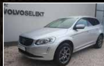
VOLVO XC60 D3 136 S&S OCEAN RACE EDITION, 11/2014, 69 341 km, Diesel