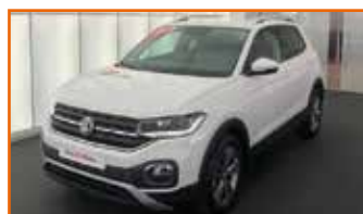
VOLKSWAGEN T-CROSS 1,0 TSI 115 S&S BVM6 LOUNGE, 07/2019, 100 km, Garantie 24 mois 23 490 €