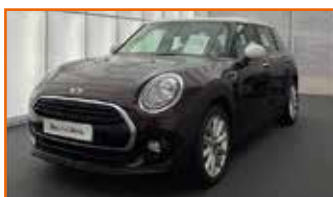
MINI MINI CLUBMAN COOPER 136 CHILI, 08/2017, 25 500 km, Garantie 12 mois 19 990 €