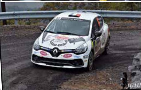
Participer au prestigieux rallye de Monte-Carlo est un rêve pour tout pilote amateur. Un rêve devenu réalité pour Boris Carminati.

B.C. : J'en ai beaucoup parlé avec Mathieu mon ouvrier. Ca reste un rallye frustrant car tu roules seulement à 70 % vu l'état de la route. Dans les formules de promotion comme le Trophée Clio R3T, tu as l'habitude d'être à 110 %. Dès que tu te lâches, tu es vite rappelé à l'ordre. On ne peut pas dire pour autant que l'on s'est traîné car on a fait quelques bon temps dont 3 meilleurs chronos en 2 roues motrices.