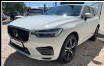
VOLVO XC60 D4 AWD ADBLUE 190 R-DESIGN, 12/2017, 10 747 km, Diesel