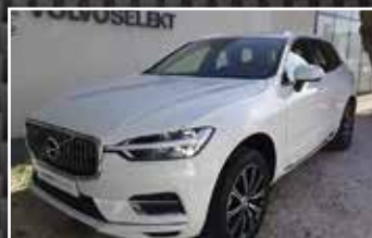
VOLVO XC60 D4 190 GEARTRONIC INSCRIPTION LUXE, 03/2019, 11 657 km, Diesel