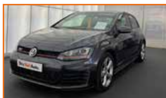
VW GOLF GTI 2.0 TSI 230 BLUEMOTION TECHNOLOGY DSG6, 04/2014, 99 990 km Garantie 12 mois 19 490 €