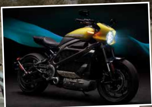
100% électrique, la Livewire™ marque une nouvelle ère.