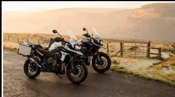
Deux séries spéciales Désert et Alpine sont proposées sur la Tiger 1200.